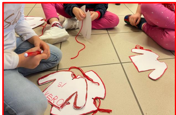
Le insegnanti e i bambini della Scuola dell'Infanzia di Cherasco

GRAZIE A TUTTI PER LO SCAMBIO CHE NASCERA' E, CHI VUOLE, NELLA PROPRIA CASA, UN MAGLIONE DI NATALE CON SE' PORTERA' !!!