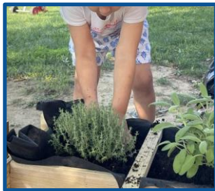
...nel giardino della nostra scuola

La prospettiva del rischio pone pertanto i bambini e prima ancora gli adulti, in una condizione di straordinaria responsabilità, in quanto autori critici e riflessivi delle proprie ed altrui esperienze di crescita. Responsabilità che è condivisa tra le diverse figure che partecipano alla crescita dei bambini e che più direttamente si occupano di sicurezza dei contesti organizzativi ai sensi della normativa vigente (edilizia scolastica, servizio prevenzione e protezione, pedagogisti, insegnanti, assistenti educativi, economi e genitori) trovando mediazioni che tengano insieme sicurezza ed orizzonti educativi di senso.